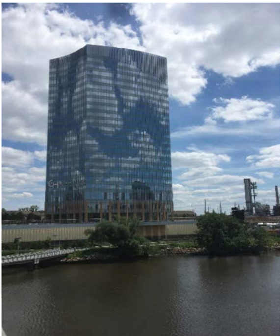
Obr. 2. CHOP Research Center