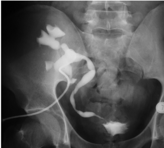
Obr. 10. Pyelo-ureterografia. Striktura terminálneho úseku močovodu

Fig. 10. Pyelo-ureterography. A stricture of the terminal part of the ureter