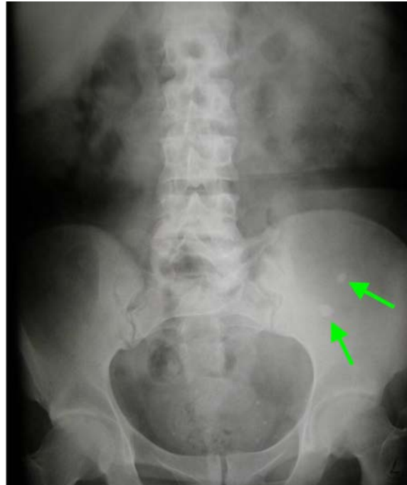
Obr. 12. Nefrolitiáza transplantovanej obličky

ké faktory, včítane terciárneho hyperparatyroidizmu, hyperkalcémie, hypocitraturie, hyperurikémie (potencovanej liečbou cyklosporinom A) a infekcie močových ciest baktériami štiepiacimi ureu a alkali- zujúcimi moč. Ku vzniku konkrementov v transplan-