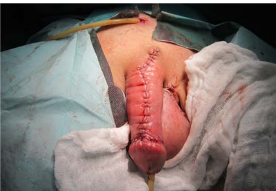
Obr. 11. Dorzální strana penisu, finální stav po sutuře

Fig. 10. The state prior to suturing at the ventral side of the penis; scrotal modelling coupled with turnover and marsupialization of the proximal urethral end to the skin of the flaps and that of the scrotum