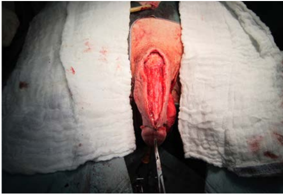
Obr. 9. Fixace laloků pod corona glandis, stav před suturou na dorzální straně penisu

Fig. 9. Flap fixation under the corona of glans penis, the state prior to suturing at the dorsal side of the penis