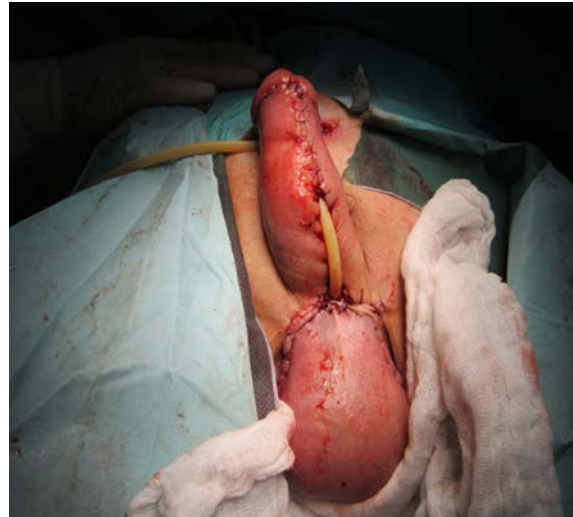
Obr. 12. Ventrální strana penisu a skrota, finální stav po sutuře s vyšitím obou konců uretry, Foley katétr Ch 16 přemostňuje chybějící část uretry

Fig. 11. The dorsal side of the penis; the final state after suturing