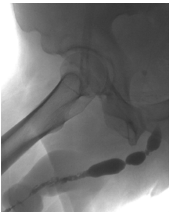
Obr. 1. UCG prokazující panstrikturu uretry

Fig. 1. UCG demonstrating panurethral stricture